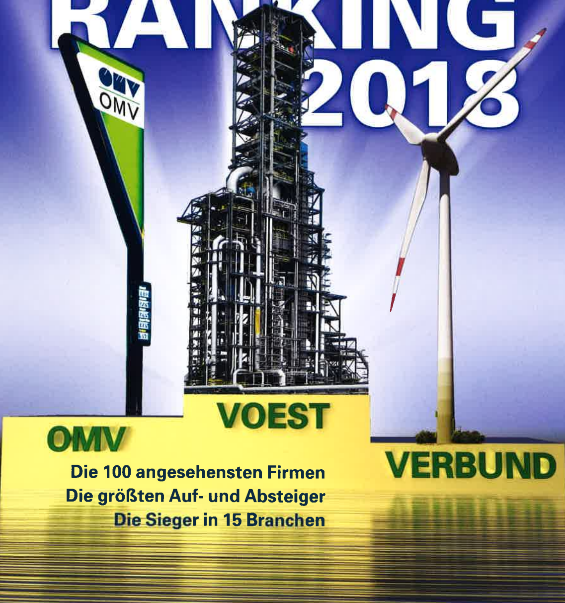
IMAGE- RANKING 2018